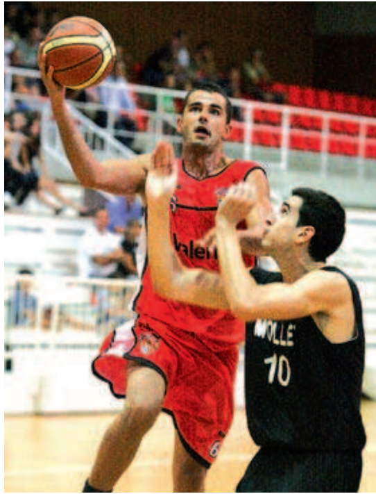
Després de l'ensopagada a casa contra el Mollet, el Valentine ha encadenat dos triomfs seguits