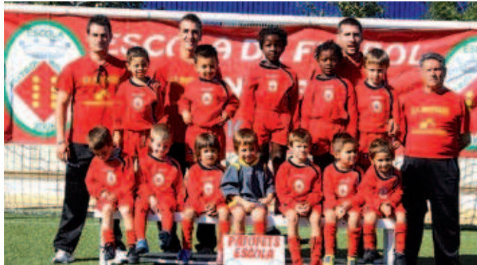
Els Patufets són les promeses més joves de l'entitat i agrupa infants de 3 a 5 anys sota una gran coordinació