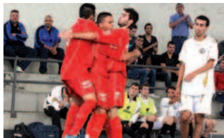
Els jugadors celebren el gol de la victòria que desfeia l'empat a 2