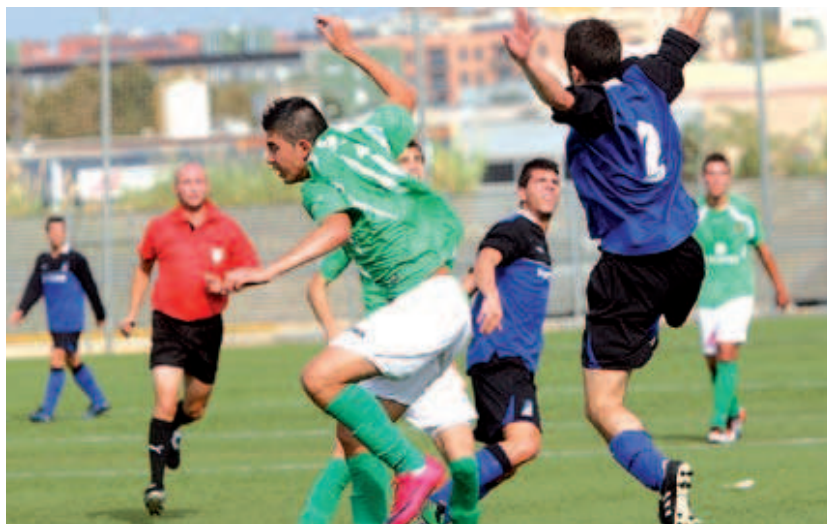
Tot i els nervis i la tensió inicial, el Montcada va sumar la primera victòria d'aquesta temporada a l'estadi de la Ferriera

El bagatge a la lliga, amb dues derrotes a casa, ha representat molta pressió: "La plantilla tenia ganes d'oferir el bon joc que practica fora de casa a l'estadi", subratlla el president qui confia que l'equip s'alliberi de la pressió i desplegui la qualitat que atesora. Sanchís ha volgut destacar que "enguanys la competició serà més igualada que mai" .