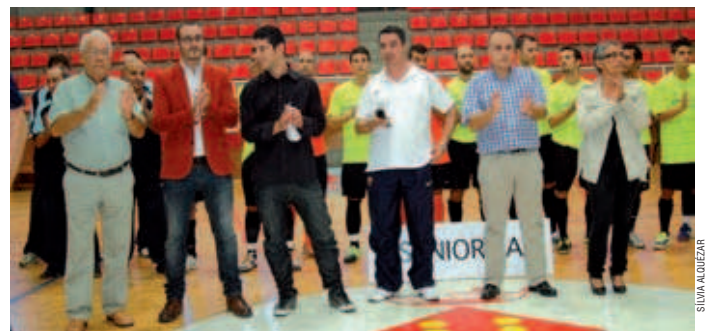
L'FS ha duplicat el nombre de jugadors. A la imatge, les autoritats i la directiva en l'acte de presentació de tots els equips