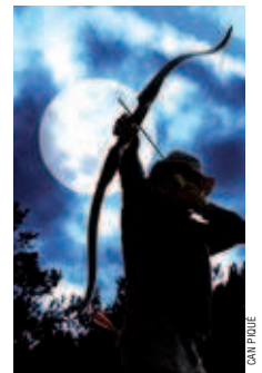
Tirada nocturna de l'any passat

Competicions europees. El Club de Can Piqué ha anunciat la intenció d'afiliar-se a l'Associació Internacional de Tir amb Arc (IFAA). Roca s'ha mostrat molt il·lusionat amb la notícia ja que així "tindrem perspectives de competir com a club a Europa", ha subratllat el president que d'aquesta