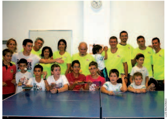
El Club de Tennis Taula Can Cuiàs té 35 socis que van des dels 7 als 58 anys i entrena a una de les sales del centre cívic

Manca d'espais. La petició que fa el club és poder entrenar en un espai més gran, ja que només disposa d'una de les sales del centre cívic un dia a la setmana.