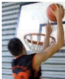
El Sots-21 ha guanyat els 4 partits

Els dos equips de bàsquet del planter de l'AE Elvira-La Salle han començat bé la competició. El sots-21 masculí és el líder del Grup Tercer del Nivell B en guanyar els quatre primers partits. Els montcadencs van superar el Vilatorrada per 70 a 59 i el Prats de Lluçanès per 56 a 77. Mentrestant, el júnior és el segon classificat del Grup