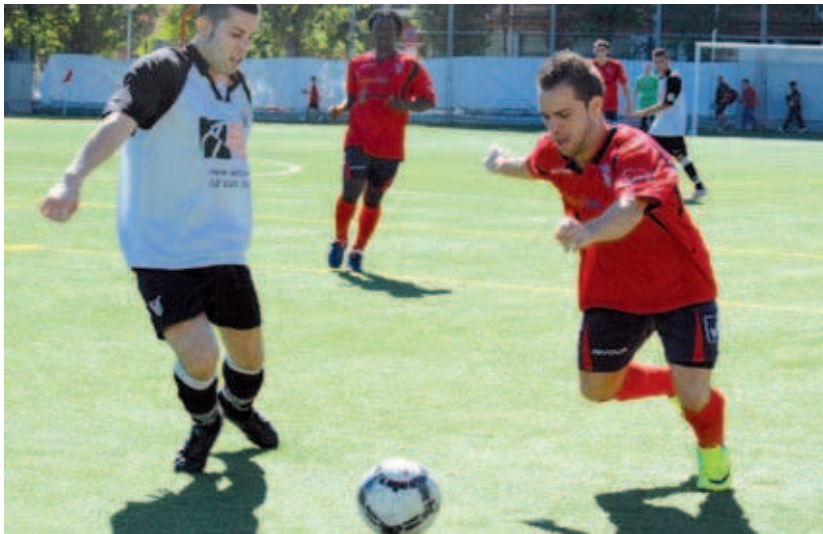
La igualtat va presidir un partit que va registrar amb una excel·lent entrada al municipal de Can Sant Joan i que no va decebre en intensitat ni emoció