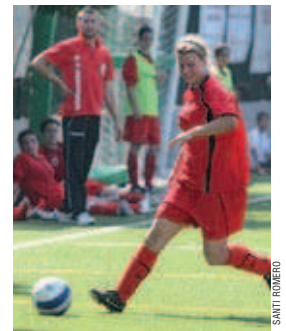
L'Escola segueix sense conèixer la derrota